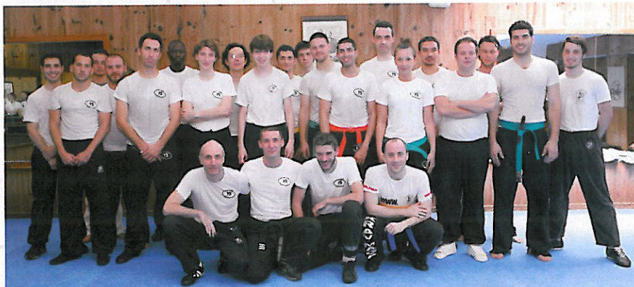
Une équipe sympathique qui vous attend pour vous aider à progresser.

sécurité, de convivialité et de respect. L'APKM connaît une très bonne réputation dans le milieu. Ce club à dimension « familiale » est accessible à tous et ne nécessite pas de qualités physiques ou psychologiques particulières. Il est possible d'assister à un cours ou de faire un cours d'essai gratuit à tout moment de l'année. Du fait de sa taille, les professeurs et les assistants sont davantage accessibles et disponibles avant ou après les cours pour des explications supplémentaires, des conseils ou simplement pour partager une passion. Les cours mixtes amènent, au travers des différents niveaux et partenaires, à développer son courage, sa maîtrise de soi et sa lucidité, qualités principales d'un pratiquant de Krav-Maga. Chacun vient avec sa propre motivation et en toute confiance.